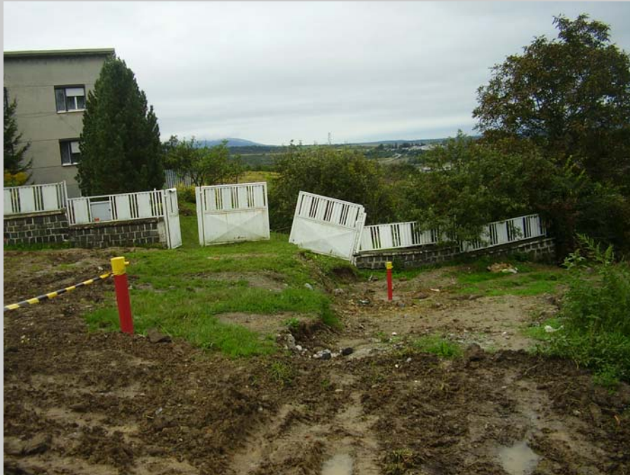
Obr. 2 Obec Nižná Myšľa, zasiahnutá zosuvmi

Po skončení konferencie krátko rokovalo aj Valné zhromaždenie ASG pri SAV. Za najzávažnejšiu diskutovanú otázku možno považovať výzvu vytvoriť novú mapu geomorfologického členenia Slovenska, ktorá by odrážala najnovšie poznatky z geologického a geomorfologického vývoja Karpát a Panónskej panvy.