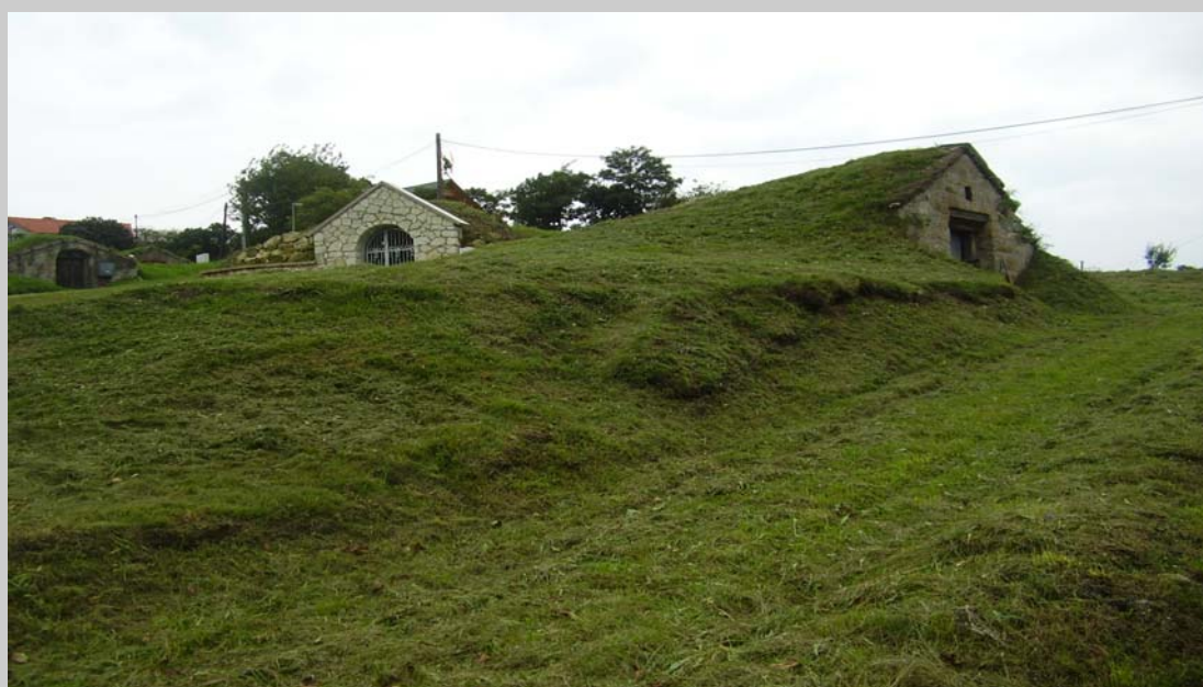
Obr. 4 Tokajské pivnice

Na záver konferencie mali účastníci možnosť zúčastniť sa na exkurzii, spolu s ostatnými účastníkmi kongresu SGS pri SAV ( Obr. 1 ). Trasa jej fyzicko-geografickej varianty viedla najskôr do obce Nižná Myšľa ( Obr. 2 ) kde sme sa oboznámili s následkami nedávnych zosunov. Ďalej sme prešli cez pohorie Slanských vrchov, s ktorých reliéfom nás oboznámil (L. Dzurovčin). Pokračovali sme po-