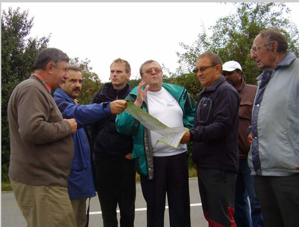
Obr. 1 Účastníci fyzicko-geografickej exkurzie v rámci 15. kongresu SGS pri SAV a 6. vedeckej konferencie ASG pri SAV