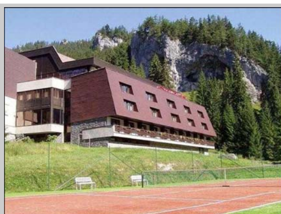
Miesto konania hotel Repiská