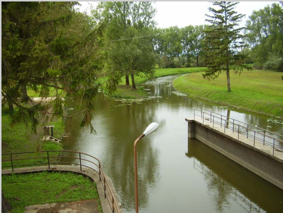
Obr. 3 Melioračné kanály v povodí Ondavy

Okrem toho sa prítomní členovia asociácie uzniesli na zvýšení členského na 10 EUR ročne. Tento krok je podmienený najmä nutnosťou vykryť financovanie dvoch čísel časopisu Geomorphologia Slovaca et Bohemica ročne. Zápisnicu z tohto rokovania prinášane na konci tejto správy.